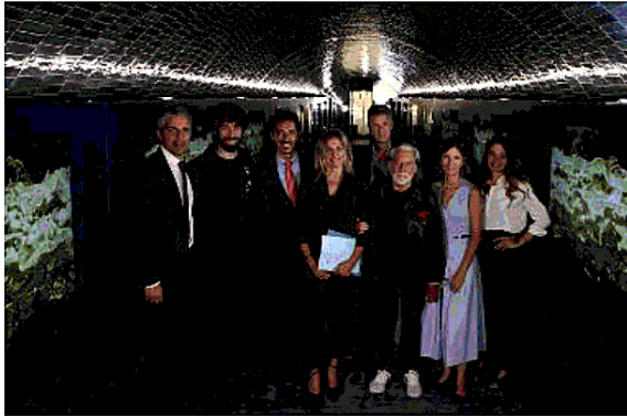
Rifugio Digitale, con l'opera di Plessi durante la presentazione degli Nft

«Rifugio Digitale» inizia il suo percorso nel mondo della CryptoArt. Nella galleria ricavata da un vecchio tunnel in via della Fornace 41, in concomitanza con la mostra di Fabrizio Plessi e in collaborazione con la casa editrice Forma Edizioni, è partita la vendita di un limitato numero di Nft dell'opera di Plessi dal titolo «Oro». Si tratta del lavoro col quale l'artista aveva inaugurato gli spazi espositivi lo scorso 14 aprile collaborazione con la TornabuoniArte. Fino al giorno di chiusura della mostra prevista per il 24 giugno, sarà possibile acquistare i token dell'opera Oro di Plessi, sia attraverso una pagina dedicata sul sito rifugioidigitale.it che direttamente negli spazi di Rifugio Digitale con un supporto informativo